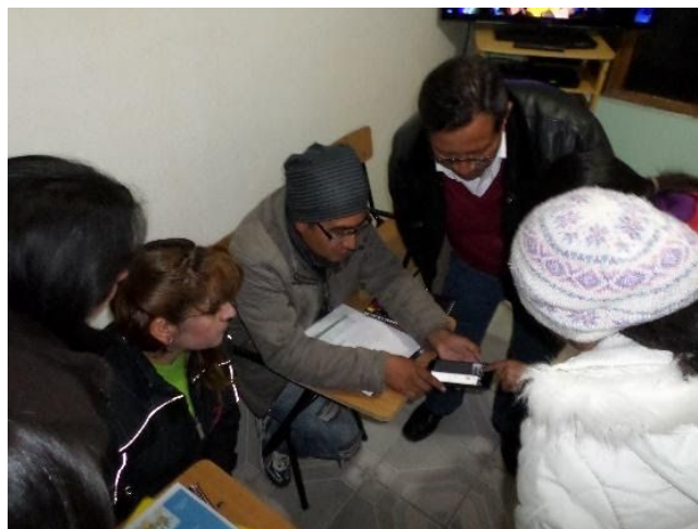
Figura 3 - Alumnos y profesores participantes del proyecto