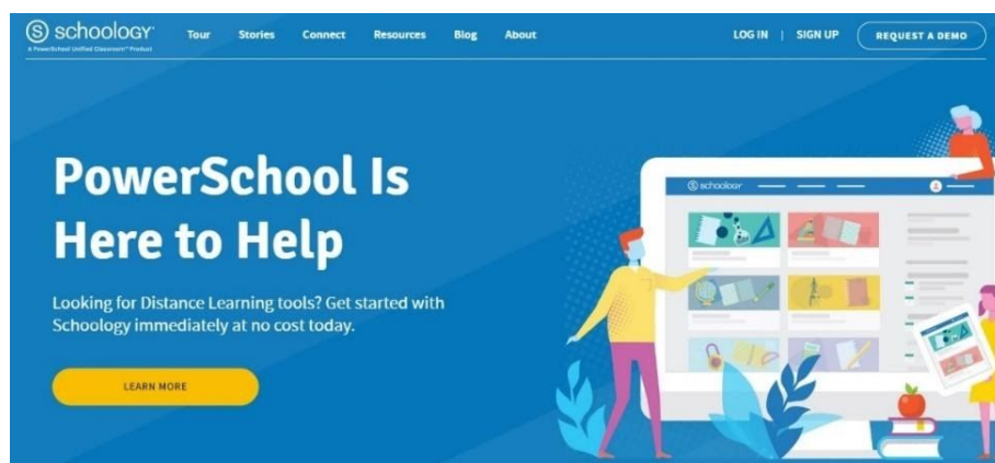
Figura 1 - Interface del EVA Schoology .